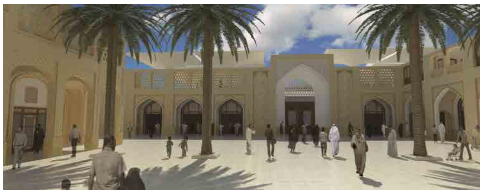
شکل ۲: ایده فضاهای نجفی

طرح برای بخش‌هایی از شهر که در مجاورت «حوزه مداخله» قرار می‌گرفتند، حساسیتی خاص داشته و بی‌دقتی در آن می‌توانست اثراتی منفی به دنبال داشته باشد و لازم بود تا تدابیری ویژه برای آن اندیشیده شود. در همین راستا، محدوده واسطی بین حوزه مداخله و شهر قدیم نجف، تحت عنوان «حوزه بلافصل» تعریف شد و برای این حوزه، پیشنهادهای دقیق ارائه گردید. این پیشنهادات که متکی بر بازدید دقیق تک‌تک دانه‌های مهم و مبتنی بر واقعیت‌های موجود این محدوده بود، شامل پروژه‌هایی می‌شد که می‌توانست حریمی عملکردی، بصری و کالبدی پیرامون طرح توسعه ایجاد نماید که از یکسو ارزش‌های موجود در این بخش را حفظ و تقویت کند و از سوی دیگر نیازهای ساکنین شهر و زائرین حرم را تأمین نماید. این پروژه‌ها در گونه‌های مستقل اما مرتبط با یکدیگر تعریف شدند. (شکل ۳) کاربری‌های مورد نیاز و جدید در قالب مجموعه‌هایی