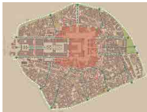
شکل ۴: اصلاح رابطه حرم مطهر علوی و شهر قدیم در پاسخ به نیازهای زائرین و مجاورین در مقیاس شهر قدیم