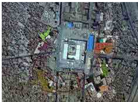
شکل ۳: طرح احیای مجموعه‌های عملکردی در پیرامون حرم

طرح برای بخش‌هایی از شهر که در مجاورت «حوزه مداخله» قرار می‌گرفتند، حساسیتی خاص داشته و بی‌دقتی در آن می‌توانست اثراتی منفی به دنبال داشته باشد و لازم بود تا تدابیری ویژه برای آن اندیشیده شود. در همین راستا، محدوده واسطی بین حوزه مداخله و شهر قدیم نجف، تحت عنوان «حوزه بلافصل» تعریف شد و برای این حوزه، پیشنهادهای دقیق ارائه گردید. این پیشنهادات که متکی بر بازدید دقیق تک‌تک دانه‌های مهم و مبتنی بر واقعیت‌های موجود این محدوده بود، شامل پروژه‌هایی می‌شد که می‌توانست حریمی عملکردی، بصری و کالبدی پیرامون طرح توسعه ایجاد نماید که از یکسو ارزش‌های موجود در این بخش را حفظ و تقویت کند و از سوی دیگر نیازهای ساکنین شهر و زائرین حرم را تأمین نماید. این پروژه‌ها در گونه‌های مستقل اما مرتبط با یکدیگر تعریف شدند. (شکل ۳) کاربری‌های مورد نیاز و جدید در قالب مجموعه‌هایی