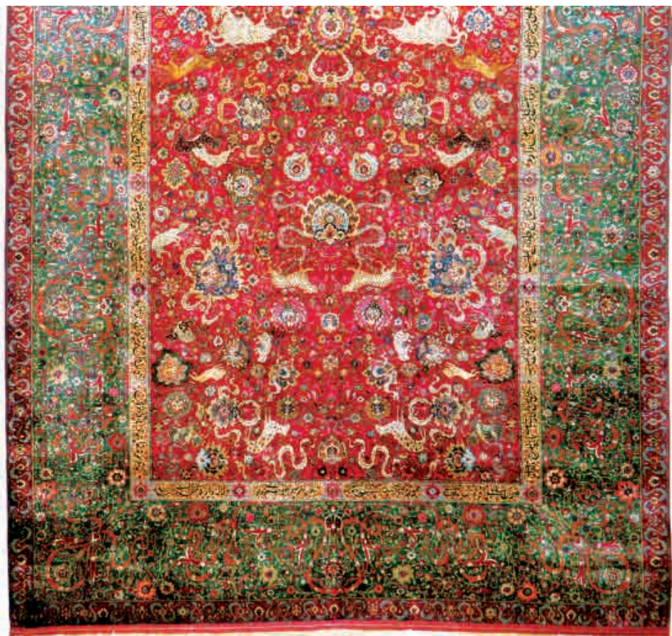
تصویر ۳- قسمتی از قالی افشان شاه عباسی جانوری (قالی امپراطور) قرن ۱۰ هـ. ق. / ۱۶ م. مؤلف هنر و صنعت وین