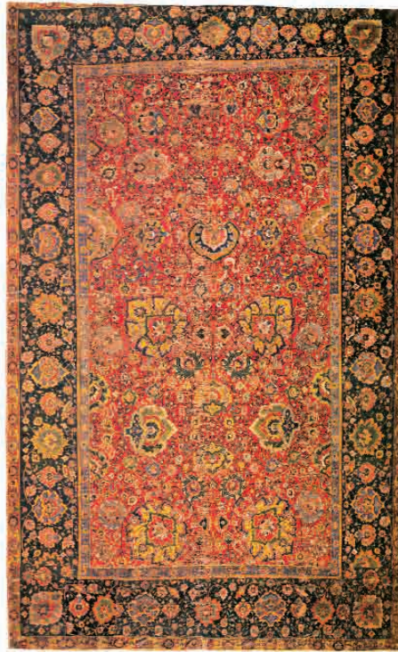
تصویر ۱- قالی افشان شاه عباسی اواخر قرن ۱۶ و اوایل قرن ۱۷ م./ ۱۰ و ۱۱ هـ.ق. موزه پولدی پوزلی میلان