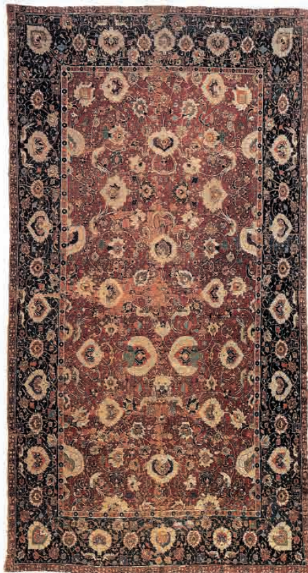
تصویر ۲- قالی افشان شاه عباسی اواخر قرن ۱۶ و اوایل قرن ۱۱ هـ.ق./ قرن ۱۶ و ۱۷ م. موزه تیسن بورنمیسزا