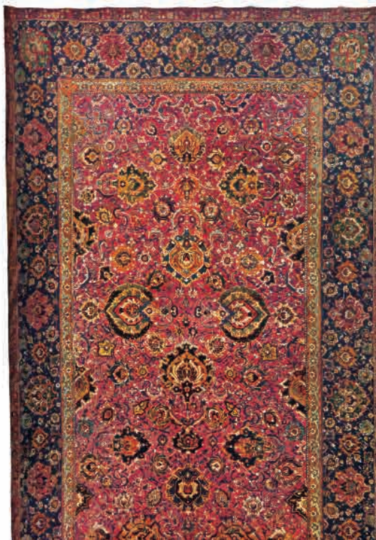
تصویر ۷: قالی افشان شاه عباسی قرن ۱۰، ۱۶ هـ. ق. مجموعه لروی