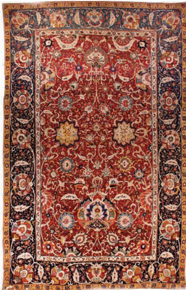
تصویر ۴ - قالی افشان شاه عباسی گلابتون دار اواسط قرن ۱۷ م. ۱۱ ه ق. موزه آستان قدس رضوی (محل بافت تصویر: اروین گانزروتن، همان، ص ۸۲)

بافته شده است پس از تحقیق از خزانه دار آستانه درباره صحت این مطلب و این که آیا مدارک مستندی که موبد این فرضیه باشد وجود دارد یا نه؟ وی اظهار داشت فهرستی در اختیار آستان قدس رضوی است که در حدود بیست و پنج سال قبل تهیه گردیده و در آن ذکر شده که قالی مزبور به دستور شاه عباس در شهر مشهد برای آستانه تهیه گردیده است. وی افزود این اظهارات متکی به روایات و احادیث است و کارشناسان نیز آن را تأیید کرده اند... (سیسیل ادواردز، ۱۳۶۸، ص ۱۸۲ و ۱۸۳) این قالی زیبا و نفیس در ابعاد ۳۵۵×۵۵۵ سانتی متر بافته شده است. متن قالی به صورت ۱/۲ طراحی شده و رنگ آن قرمز تیره است. گل های شاه عباسی برگ کنگری بسیار بزرگ، اسلیمی های ابری و همچنین الیاف فلزی به کار رفته در بافت آن از شاخصهای این فرش هستند، یکی از عواملی که سبب شده تا قالی از نفاست بالایی برخوردار شود استفاده از نخ گلابتون [۱۹] برای بافت قسمت های از قالی است. آرتور پوپ معتقد است. باب شدن قالی هایی زربفت و سیم بفت در ایران سبب تولید این گونه از فرشها در خراسان شده است و این شیوه بافت باعث شده تا حدی از کیفیت قالیهای