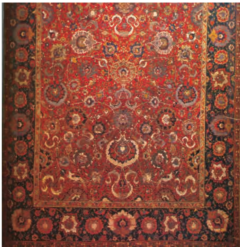
تصویر: قالی افشان شاه عباسی، قرن ۱۷ م. ۱۱ هـ. ق. موزه ویکتوریا و آلبرت لندن

این دستبافت هم اکنون در موزه ویکتوریا و آلبرت لندن نگهداری می شود. ترکیب بندی خوب طرح و رنگ در این دستبافت باعث خلق یکی از زیباترین طرح های افشان شاه عباسی در ایالت خراسان شده است. طرح افشان به صورت ۱/۲ اجرا شده، گلهای شاه عباسی برگ کنگری، پرنده ها و اسلیمی های ابری جلوه درخشانی به متن قرمز لاکه این دستبافت داده است. در اطراف قالی سه نوار تزئینی (حاشیه) مشاهده می شود رنگ حاشیه اصلی آبی تیره (سورمه ای) است و ترکیب بندی هراتی بر حاشیه این قالی اجرا شده است. (تصویر ۵) ■ ۶) قالی افشان شاه عباسی _ اسلیمی که در اواسط قرن ۱۶ م. ۱۰ هـ. ق. احتمالاً در ایالت خراسان بافته شده است. این دستبافت در ابعاد ۲۸۵×۴۵۵ سانتی متر در مجموعه سانگیورگی [۲۱] نگهداری می شود. متن قالی قرمز تیره است و ترکیب اسلیمی و ختایی در آن به صورت ۱/۲ اجرا شده است. به نسبت دیگر آثار بررسی شده، گلهای شاه عباسی در این دستبافت از ظرافت