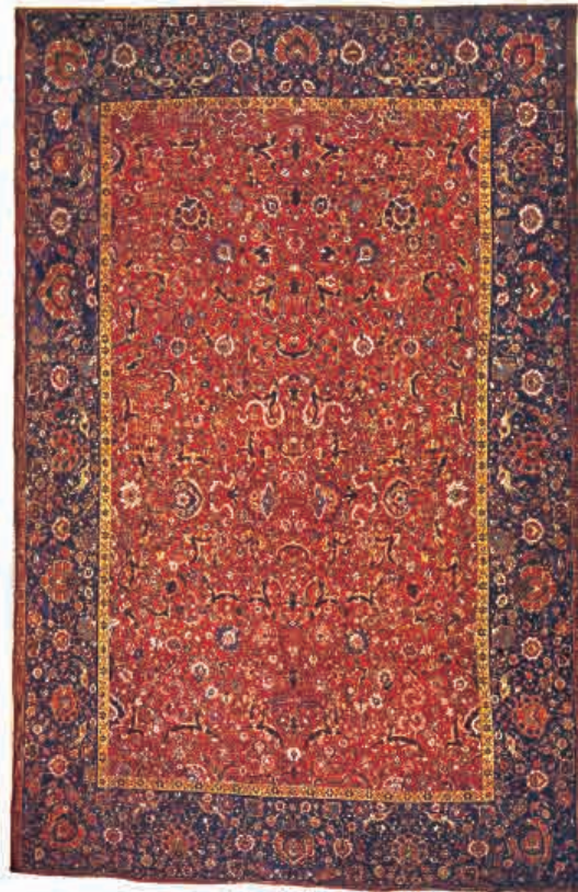
تصویر ۶: قالی افشان اسلیمی و شاه عباسی، نیمه قرن ۱۰، ۱۶ هـ. ق. مجموعه سانگ بیورگی (مأخذ: تصویر: Arthur Upham Pope, A. Survey of Persian Art (Vol. XII), p. 118)

با مشاهده تصاویر بالا می توان گفت هنر قالی بافی خراسان عصر صفوی در تولید قالی های افشان شاه عباسی متجلی شده است. با توجه به چند قالی بررسی شده در این مقاله که متعلق به این دوران است می توان ویژگیهای قالی های خراسان را به صورت زیر بیان کرد: شاخص هایی که با کمترین تغییر در شیوه ترکیب بندی نقوش و یا رنگ بندی پس از گذشت ۴۰۰ سال همچنان در بافت قالی مشهد به کار می روند: اکثر قالی ها دارای سه نوار تزئینی (حاشیه) هستند و با توجه به برخی طرح های متفاوت که در حاشیه اصلی به کار می رود می توان گفت که حاشیه اصلی (پهن یا بزرگ) در اکثر قالی ها مزین به طرح هراتی است. در طراحی و ترکیب بندی متن قالی ها گلای شاه عباسی برگ کنگری نقش اصلی را بر عهده دارند و اسلیمی ابری (ابر چینی یا ماری) از دیگر عناصر اصلی قالی های افشان شاه عباسی هستند. ترکیب بندی کلی نقوش ختایی در متن قالی بیشتر به صورت ۱/۲ و تعداد کمی با طرح ۱/۴ طراحی شده اند. قالی با طرح حیوانات و یا گرفت و گیر کمتر در این ناحیه بافته می شود. (برخی از فرشهای افشان جانوری که منتسب به این ناحیه شده اند را به علت کیفیت بالای طراحی و یا بافت آنها، می توان رد نمود). رنگ بندی حاشیه اصلی (بزرگ) در بیشتر قالی ها آبی تیره و گاهی سبز تیره است. رنگ متن اغلب قالی های عصر صفوی قرمز تیره بوده است و تنها يك مورد قرمز روشن (صورتی) مشاهده می شود. قالی ها اغلب در ابعاد بزرگ بافته می شوند که نشان می دهد قالی ها در کارگاه های شهری یا حکومتی بافته شده اند. وجود قالیهای بزرگ پارچه شاید دلیل بافت آنها برای مکانهای مذهبی (به خصوص حرم مطهر رضوی) باشد.