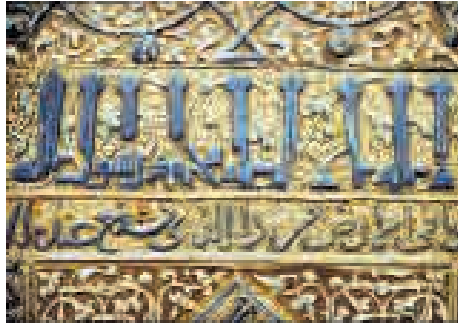
تصویر ۱: بخشی از محراب زرین فام مسجد میدان کاشان، اثر «حسین بن عربشاه» به تاریخ ۶۲۳ هجری قمری، موزه اسلامی برلین

به فرد کاشی زرین فام در جهان به شمار می‌رود.