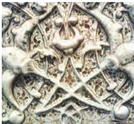
تصویر ۲: بخش‌هایی از محراب زرین فام حرم مطهر رضوی، سده لاق، بدنه برجسته با قالب و نقاشی

زرین فام به فن سرو لعابی اطلاق می‌گردد که حاصل آن تشکیل یک لایه فلزی (طلا مانند) با درخشش قوس و قزحی است که در طیف رنگ‌های مختلفی همچون قهوه‌ای، سبز کم‌رنگ، قرمز، نارنجی، زرد، آمبر و نقره‌ای بر روی لعاب از پیش پخته به وجود می‌آید. در این فن پس از پخت اولیه لعاب، لایه نازکی از ترکیبات مختلف مس و نقره به همراه گل اُخری بر روی لعاب از پیش پخته قرار داده می‌شود که پس از حرارت دهی مجدد و در غیاب اکسیژن در اثر شکست مولکولی ترکیبات فلزی یادشده تحت احیاء، لایه نازک فلزی سروی سطح لعاب می‌نشیند و پس از سرد شدن و تمیز کردن قطعه کاشی زرین فام با درخشندگی فلزی قوس و قزحی ظاهر می‌شود. نوع رنگ زرین فام حاصله براساس ترکیب پیگمنت‌ها، میزان و مدت احیاء و طول مدت سرد شدن متغیر است.