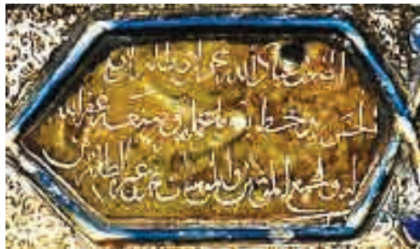
تصویر ۶. رقم سازنده و نام بانی در دو کتیبه محراب زرین‌فام حرم مطهر رضوی.

همچنین مجموعه‌ای از کاشی‌های نقش برجسته زرین‌فام نیز در پیشانی