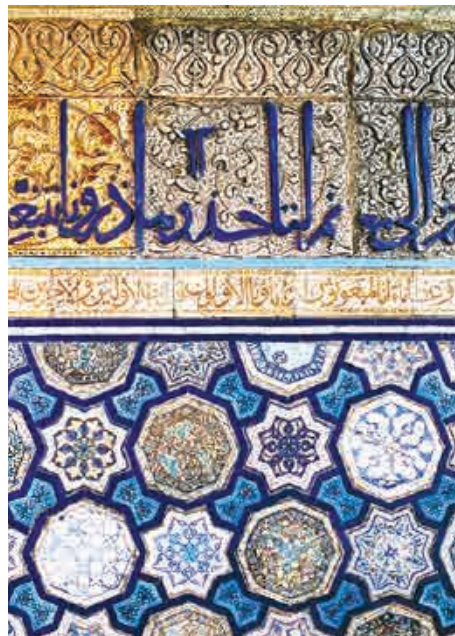
تصویر ۱۱. کاشی‌های زرین‌فام کتیبه‌دار و ستاره‌ای از ازاره روضه منوره حرم رضوی، قرن هشتم هجری.

کاشی‌های زرین‌فام ستاره‌ای شکل و کتیبه‌داسر روضه منوره نیز در کنار این سه محراب انر اهمیت ویژه تاریخی- هنری برخوردارند چرا که نقطه اوج موفقیت و پیشرفت فنی- هنری سفالگران زرین‌فام کاشان به حساب می‌آیند، که بررسی و معرفی آن‌ها فرصتی دیگر می‌طلبد. (تصویر ۱۱)