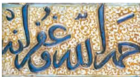
تصویر ۳. کتیبه نقش برجسته زرین‌فام، به خط ثلث، ساخت کاشان، احتمالاً برای مزار شیخ عبدالصمد نطنزی

بدنه کاشی‌های زرین‌فام همواره به دو شکل تخت یا خشتی با سطح برجسته تولید می‌شد (تصویر ۲) اخرجمله زیباترین کاشی‌های خشتی برجسته می‌توان از کاشی‌های نقش برجسته تخت سلیمان و مرقد امام‌رضا(علیه‌السلام) و حضرت معصومه(علیها‌السلام) یاد کرد. در این شیوه ابتدا قالبی منفی از سطح کاشی (شامل نقشی که برجسته می‌شد) ساخته می‌شد و پس از خشت زنی ابتدا بدنه کاشی پخته و سپس با غرق کردن بدنه در لعاب قلع (لعاب اپک: که ترکیبی است از اکسید قلع و لعاب ترانس)، روی آن را از لایه سفید رنگ پوشانده و دوباره درون کوره می‌پختند. در پخت آخر لعاب زرین‌فام را هنرمند نقاش (که غالباً همان سفالگر و سازنده کاشی بود) روی سطوح برجسته می‌کشید و یا به صورت لایه‌ای بسیار نازک از لعاب در فضای منفی نقش می‌پاشید و اشکال گیاهی و خطوط را با خراش به‌وسیله یک جسم نوک تیز ایجاد می‌کرد. در برخی از نمونه‌ها علاوه بر رنگ سفید زمینه و رنگ زرین‌فام، از لعاب لاجوردی نیز برای قلم‌گیری و یا رنگ اندازی در برخی از قسمت‌ها استفاده می‌شد. البته این عمل در هنگام دومین پخت انجام می‌گرفت.