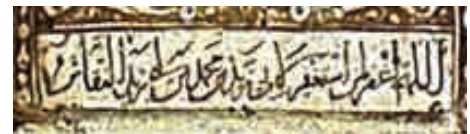
تصویر ۸. رقم زید بن محمد بن ابی خرید نقاش، در محراب پیش روی مبارک، تاریخ ۶۱۲ ق، کاشان

همچنین رقم محمد بن ابی خرید نقاش که احتمالاً کار نقاشی و خوشنویسی بخشی از محراب را بر عهده داشته در مرکز محراب و در حاشیه پایینی طاق‌های دوم با خط رقاع با لعاب زرین فام نوشته شده است. تصویر ۸. امضای ابوزید روی تعدادی از کاشی‌های ستاره‌ای شکل، به تاریخ اولین دهه سده هفتم هجری (بین ۶۰۰ تا ۶۱۷ ه. ق) و نیز نقاشی‌هایی بر ظروف زرین فام نیز دیده شده است.