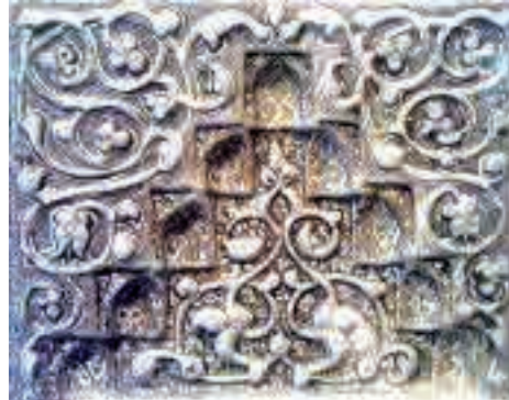
تصویر ۱۰. بخش‌های میانی محراب زرین‌فام پایین پای مبارک، نقوش برجسته اسلیمی و کتیبه به خط کوفی

گفتنی است، هماهنگی میان کتیبه‌های خوشنویسی و تزئینات زمینه، در کنار قالب گیری کم نظیر نقوش اسلیمی برجسته در محراب‌ها و کاشی‌های حرم مطهر امام هشتم (علیه‌السلام) که هنوز زنده و منظم هستند، مجموعه‌ای چشم نواز و منحصر بفرد از شکوه هنر سفالگری ایرانی در قرون هفتم و هشتم هجری را به نمایش می‌گذارند، که بازنگری و تجزیه و تحلیل آن از هر منظر مفید و مورد نیاز هنرمندان و محققین امروز به شمار می‌آید.