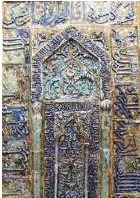
تصویر ۹. محراب بالای سر مبارک، اثر علی بن محمد بن طاهر کاشانی، تاریخ ساخت: ۶۴۰ ق. اندازه: ۲۰۴ × ۱۲۴ س. م.

توانایی هنری علی بن محمد در دهه‌های میانی سده هفتم هجری شکوفا گردید به طوری که بزرگ‌ترین اثرش راه، یعنی مجموعه کاشی‌ها و محراب زرین فام امامزاده یحیی دس ورامین که امروزه در موزه دانشگاه فیلاذلفیا نگهداری می‌شود اجرا کرد. او همچنین محراب زرین فامی را به تاریخ ۶۶۳ ق ساخت که در آرامگاه نجف نصب گردید.