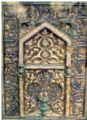
تصویر ۴. دو محراب زرین‌فام با کتیبه ثلث و نقوش قندیل (چراغ) در طاق‌های سرپوش، دوره ایلخانی، موزه ویکتوریا آلبرت، لندن

گفتنی است کاشی‌های زرین‌فام نیز در تزئینات داخلی روضه منوره حرم استفاده گردیده، که در شکل‌ها و اندازه‌های مختلفی همچون ستاره هشت‌پر در اندازه‌های مختلف، ستاره شش‌پر، چلیپا (صلیبی) و چهارگوش (با نقوش برجسته)، همچنین شش و هشت ضلعی خشتی با نقاشی زرین‌فام هم‌زمان با ساخت محراب‌ها تولید و در آنجا نصب گردیده است. البته گاهی نیز به مقتضای محل نصب به اندازه‌های غیر معمول و همراه با کتیبه ساخته می‌شده است. درحقیقت هنرمندان اسلامی در زمان‌های مختلف و مکان‌های گوناگون، اصول هندسی را در طرح الگوهای عملی در پیشه خویش به کار می‌گرفتند و براساس نظم و تکرار نقش مبنایی، طرح را در سراسر