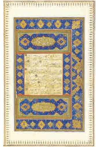
تصویر ۲ صفحه فاتحة الكتاب قرآن شماره ۳۹ مانند آرشو تصویری مکر آفرینش های هنری آستان قدس رضوی. جدول ۲، شناسنامه قرآن ۳۹، کتابخانه موزه ملی ملک. تصویر ۵، کتیبه متن قرآن ۳۹، شکل ۲، تحلیل خطی قرآن ۳۹، مانده نگارنده، تصویر ۶، حاشیه قرآن ۳۹.