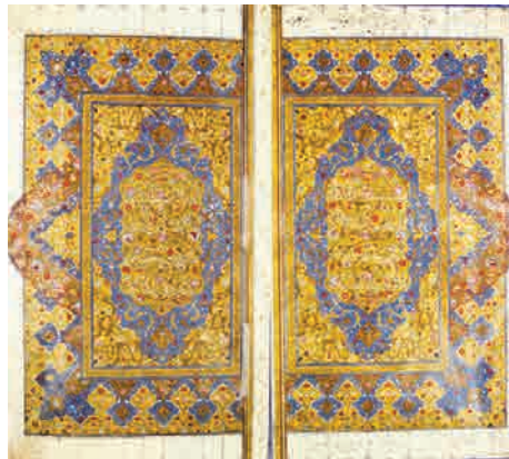
تصویر ۱. صفحه فاتحه‌الکتاب قرآن کاتب شیرازی، ۹۱۱ ه. ق. (آرشیو تصویری نفیس خطی کتابخانه آستان قدس رضوی مشهد).

دو صفحه فاتحه‌الکتاب قرآن نفیس که در این مقاله مورد بررسی و مطالعه تطبیقی قرار می‌گیرد مربوط به دو مجموعه داخلی است؛ قرآن شماره ۱۲۶ از گنجینه نفیس قرآنی کتابخانه آستان قدس رضوی و قرآن شماره ۳۹ موسسه کتابخانه و موزه ملی ملک است که تا کنون مورد بررسی قرار نگرفته است. مشخصات شناسنامه‌ای این آثار در جداول شماره ۱ و ۲ به تفکیک ذکر شده است و در پی آن عناصر تزئینی صفحات فاتحه‌الکتاب هر قرآن مورد بررسی و مقایسه قرار خواهد گرفت.