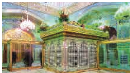
نمای کلی ضریح شیر و شکر - ۱۳۷۸ ش.