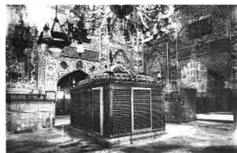
ضریح فولادی شاه‌عباسی که در سال ۱۳۳۸ ش. با ضریح شیر و شکر تعویض شد.

ضریح مذکور در سال ۱۳۳۸ ش تعویض و به جایش ضریح شیر و شکر نصب گردید. مشخصات ضریح مذکور که اکنون در موزه آستان قدس نگهداری می‌شود به قرار ذیل