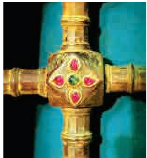
جواهرات مرصّع ضریح نادری.