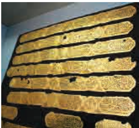
کتیبه‌های طلای محجر شاه‌تهماسپی - موزه مرکزی آستان قدس رضوی