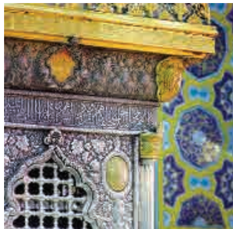
ضریح شیر وشکر- بخشی از تزیینات