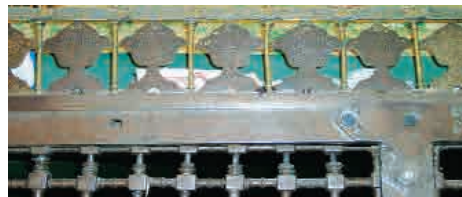
بخشی از مشبک فولادی و تزیینات بالای ضریح شاه‌عباسی