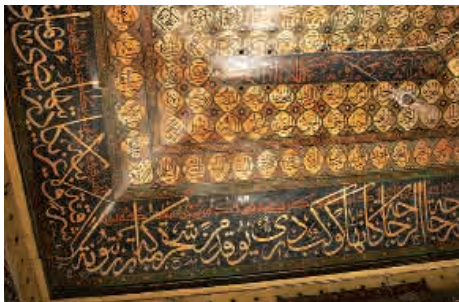
ضریح شیر وشکر- بخشی از تزیینات