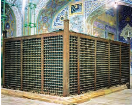
ضریح مکمل نادرشاهی بعد از برداشتن ضریح شیر و شکر - ۱۳۷۹ ش.