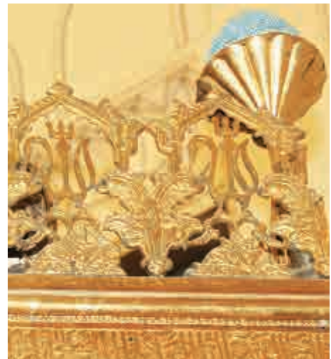
ضریح شیر و شکر - یکی از قبه‌های فیروزه نشان