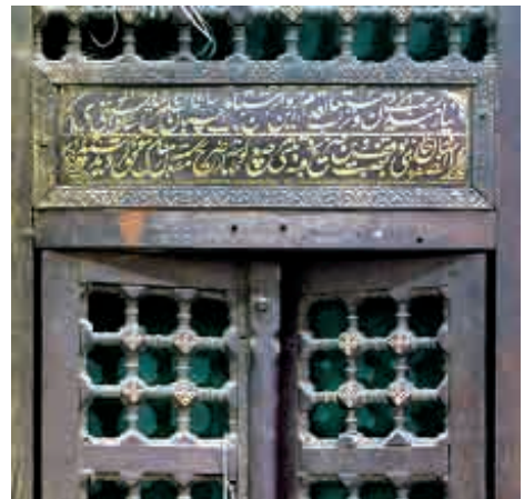
کتیبه ضریح نادرشاهی - موزه مرکزی آستان قدس رضوی به قسمت زیرین روضه منتقل و نصب گردید.

مرتفع‌تر از ضریح فولادی شاه عباسی بود، برای آن که کتیبه ضریح نادری اثر شبکه ضریح شیر و شکر نمایان نباشد، پایه ضریح نادری بر قطعات چوب در داخل قراس داده شد تا در صورتی که عریضه یا نذری بین دو ضریح قرار گیرد با سهولت به کف ضریح سرازیر و منتقل گردد و نیز به سهولت بتوان آن را غبار روبی نمود (مهران، ۱۴). در سال ۱۳۷۹ ش این ضریح کوتاه و بدون سقف و به رنگ قهوه‌ای در روضه منوره قابل رؤیت بود. در کتیبه وقف‌نامه این ضریح چون کلمه وقف به نصب آمده بود با محدودیت شرعی روبه رو شده، مشکلاتی فنی ایجاد نموده در جریان تعریض ضریح سیمین و خرزین در این سال فضایی در زیر روضه منوره احداث و ضریح نادری به قسمت زیرین روضه منتقل و نصب گردید.