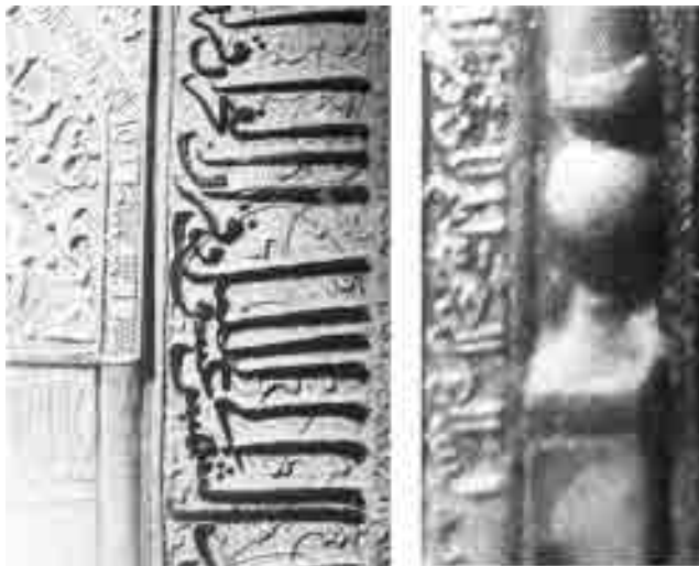
سبو و کتیبه به خط ثلث در محراب یکی از سه محراب کاشی زرین فام آستان قدس رضوی زرین فام آستان قدس رضوی معروف به محراب پیش رو

شیعی است و با مفهوم پنج تن مقدس هماهنگ است. شش ستون ایستا که با ده سبو مرتبط هستند و نماد درخت زندگی و آب حیاطند که مرکز و نقطه ثقل آفرینش مادی هستند و یک قندیل که در قلب محراب محکم و استوار برای همیشه جاویدان گشته و نماد نور پروردگار در قلب مؤمن است. در اینجا فلسفه عرفان اسلامی که وحدت در کثرت است به زیبایی به تصویر کشیده شده است. کثرت آرایه‌ها نماد کثرت موجودات است و وحدت ترکیبی این عناصر نماد وحدت وجود حول محور حق است. این ترکیب نمادها در دو نمونه محراب دیگر آستان قدس رضوی نیز دیده می‌شود.