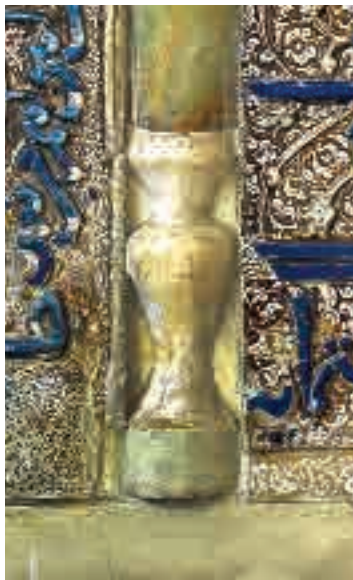
تصویر ۲. سیو در پایین ستون محراب زرین‌فام آستان قدس رضوی

دستور عزیزبن آدم و توسط خانواده محمد بن طاهر در کاشان ساخته شده است. این اثر ارزشمند منقوش به نقوش برجسته اسلیمی و ختایی و کتیبه‌های برجسته به خط ثلث و به رنگ لاجورد است که آیاتی از سوره‌های مائده، آل عمران، الاسراء، المؤمنون، بقره و فاتحه الكتاب بر روی آن کتیبه شده است. تزیینات محراب دارای برجستگی است که در آن گل‌های اسلیمی و ختایی و رنگ‌های طلایی و قهوه‌ای به کار رفته است (کنجینه نفایس رضوی، ۱۳۸۷: ۹۲). در بدنه محراب شش ستون به کار رفته که بالا یا پایین هر ستون سبویی قرار دارد و در مرکز محراب که قلب محراب است، قندیلی آویخته است. دور تا دور محراب، خطوط کوفی و ثلث، آیات الهی را به تصویر کشیده‌اند که همگی با آرایه‌های گیاهی تزیین شده‌اند. در تصویر ۱ قندیل آویخته در قلب محراب و هشت سبوی در بالا و پایین هر ستون دیده می‌شود. به نظر تیتوس بوركهارت قندیل یادآور مشکوة است که قرآن از آن بدین بیان یاد می‌کند: