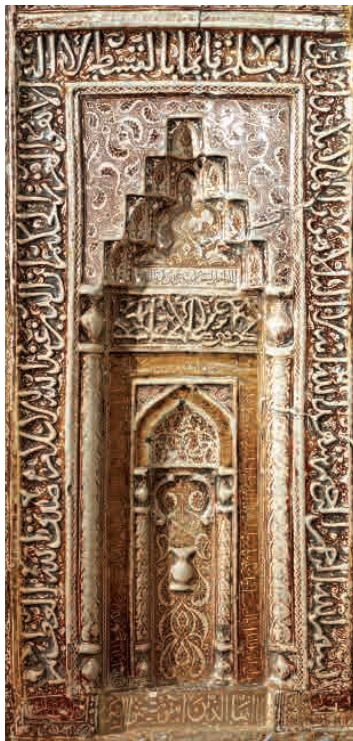
تصویر ۱. قندیل در مرکز محراب زرین‌فام آستان قدس رضوی و سیو در بالا و پایین ستون‌های محراب