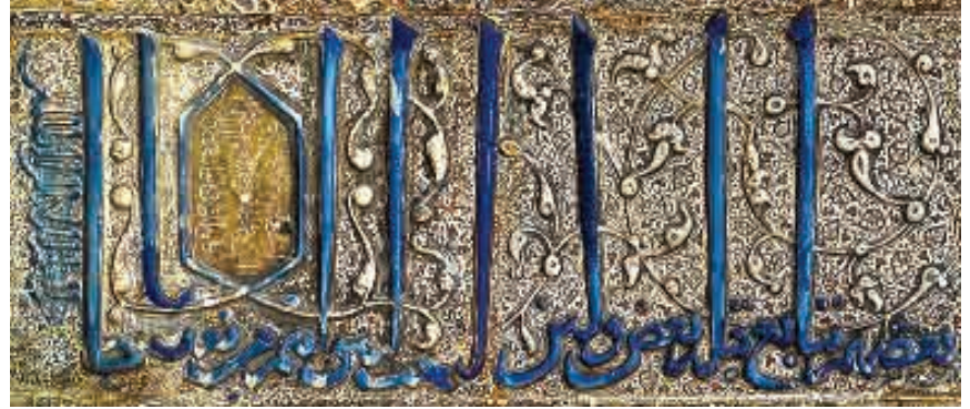
تصویر ۳ کتیبه قرآنی به خط ثلث، بر آرایه گیاهی ختایی نماد حیات، محراب زرین فام آستان قدس رضوی

آرایه ختایی که نماد گیاهی- درختی است و مفهوم برکت و رشد را در قلب خود دارد، همراه با کلام الهی ظاهر شده است (تصویر ۳).