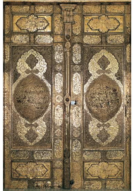
در طلای ملمع تقدیمی ناصرالدین شاه قاجار

زهی جلالت شاهی که جبرئیل امین بر آستانه آن بنده‌ای است بی‌مقدار (اعتماد السلطنه، ۳۷۳)