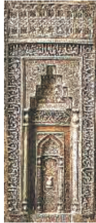
(تصویر ۲) طاق نمای کوچک محراب با نقش قندیلی (بخشی از تصویر محراب پیش رو)

در مصوّرسازی روایات منتسب به امام رضا(ع) بدین بخش اثر زندگانی امام توجه بیشتری نموده‌اند که اثر آن جمله می‌توان به نگارهٔ قدمگاه اشاره نمود. نسخهٔ فالنامه که متعلق به مکتب نگارگری قزوین است، به قطع رحلی بزرگ (۴۵×۵۹ سانتی‌متر) است که مالک دیلمی آن را به خط فارسی و به قلم نستعلیق کتابت نموده است و احتمالاً نگارگری برخی اثر تصاویر آن را آقامیرک و عبدالعزیز برعهده داشته‌اند. اثر این نسخه ۲۸ مجلس نگارگری وجود دارد که به صورت پراکنده در مجموعه‌های مختلف نگهداری می‌شوند. ۲