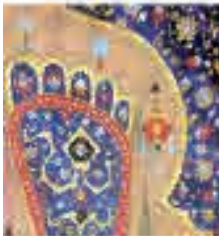
(تصویر ۶) بخشی از تصویر (۱)