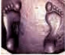
(تصویر ۴) تصویر اثر جای پای امام رضا (ع) قدمگاه امامزاده محروق در تلاجرد