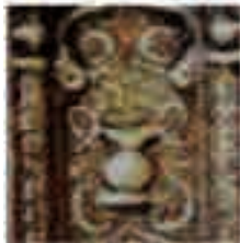
(تصویر ۹) بخشی از تصویر (۲)

دروازه‌ای از بهشت است. ۱۵ از این رو، تشابه عناصر بصری محراب اطراف نقش جای پاها (نقوش اسلیمی و ختایی و قندیل و غلبه رنگ‌های لاجوردی و طلایی) با آرایه‌های تزیینی محراب پیش روی حرم امام رضا (ع) احتمال الهام گرفتن نگارگر را از محراب حرم امام هشتم تأیید می‌نماید (تصاویر ۸ و ۹).