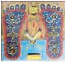
(تصویر ۵) بخشی از تصویر (۱)