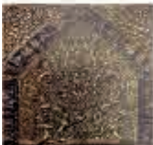
(تصویر ۷) بخشی از تصویر (۳)