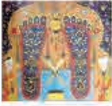
(تصویر ۸) بخشی از تصویر (۱)