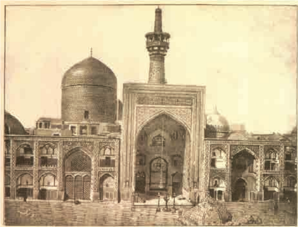
ایوان طبری مسجد