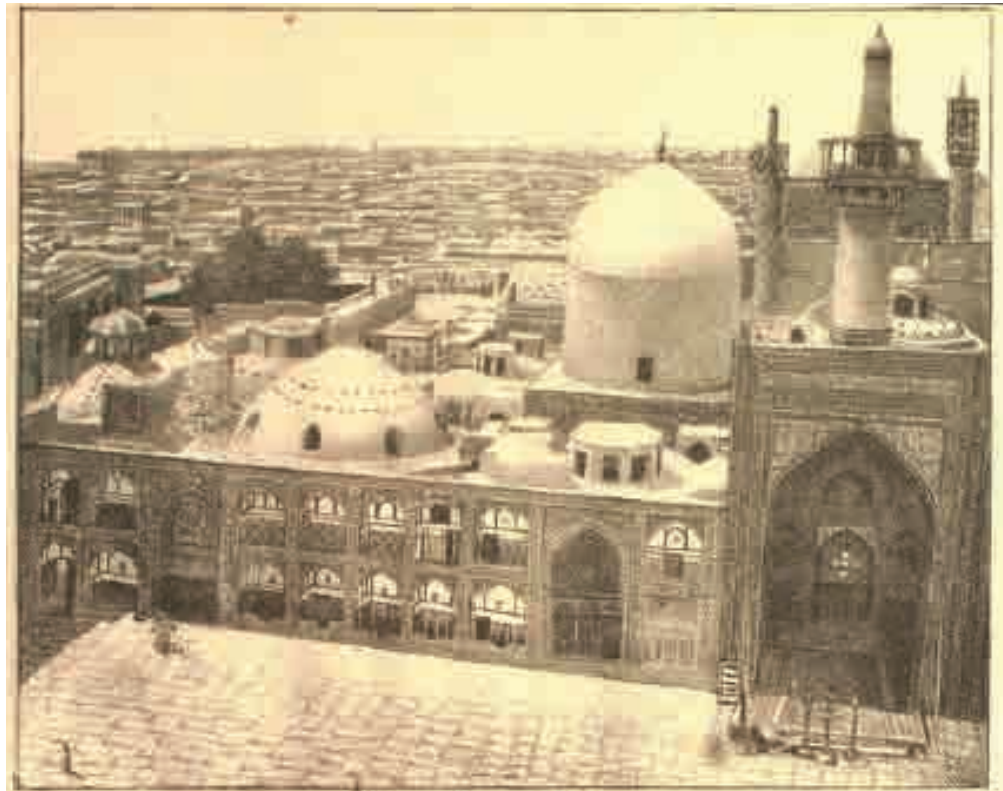
آبوان طای صحیحہ کطرف ارضین دو نمازی