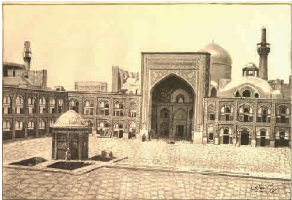
آبوان دو طرف ارضین دید و نماز