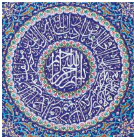
تصویر ۵. کاربرد شیوه قصارنویسی در کتیبه‌نگاری، نمای بیرونی ایوان شرقی صحن جدید، محمدحسین رضوان.