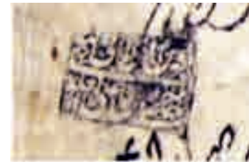
تصویر ۵. ضرب مهر شهاب‌الدین علی علوی، ۱۱۹۶ ق.