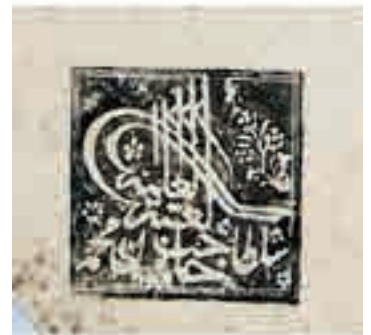
تصویر ۱۱. ضرب مهر سیف‌الدوله با سجع «حاجب‌العتبه‌العلیه سلطان محمد ۱۲۸۹»