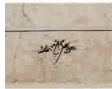
تصویر ۶. عرض سال ۱۲۴۸ بر پشت ورق پنجم بدون ضرب مهر