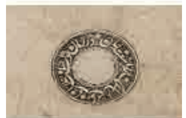
تصویر ۱۲. ضرب مهر مؤمن‌الملک با سجع «در زمان تولیت جناب جلالت مآب مؤمن‌الملک میرزا سعیدخان»