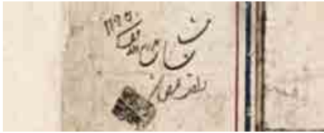
تصویر ۴. مهر و عرض در قرآن بایسنغری به تاریخ ۱۱۹۶ ق.

در تاریخ رمضان ۱۲۷۴ ق و ذیقعه ۱۲۷۵ ق بیان شده است. ۴ از این رو به رغم نظر محققان قاعده یکسانی در به کار بردن عبارات «داخل عرض شد» و «زیارت شد» نبوده و درج عبارت «داخل عرض شد» قرآن بایسنغری را نمی توان سند قطعی جهت تعیین زمان دقیق ورود این برگ ها به کتابخانه تلقی کرد.