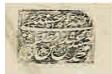
تصویر ۸. ضرب مهر عضد الملک با سجع «عبده محمدحسین بن فضل‌الله‌الحسینی ۱۲۴۶»