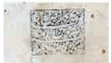
تصویر ۱۳. ضرب مهر وقف که بر اکثر نسخ ضرب شده است.