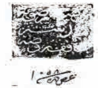
تصویر ۲. قدیمی‌ترین یادداشت عرض در نسخ آستان قدس رضوی به تاریخ ۱۰۵۸.