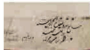
تصویر ۹. عرض دید بدون مهر به تاریخ ۱۲۷۵ ق

با استفاده از حرف کشیده «ی» معکوس در «الحسینی» فضای مهر را به دو قسمت تقسیم کرده اما به سبب تجمع و ارتفاع دوایر در پایین مهر، حرف کشیده بر یک سوم عرض مهر قرار گرفته است. با این حال تنظیم مناسب سواد و بیاض و جای‌گیری درست حروف و دقت در برابری و محاذات اشکال مشابه، مثل دوایر، ترکیبی متعادل پدید آورده است. جای‌گیری واژه «الله» در بالای سمت راست از ظرایفی است که حکاک در تنظیم ترکیب به‌کار برده است. زمینه مهر پوشیده از قوس‌های حلزونی و نقوش ختایی بسیار ظریف است. طراحی اندازه ضخامت ساقه‌ها و گل‌ها بسیار دقیق و هوشمندانه است چرا که ضخامت بیشتر این نقوش سواد و بیاض خط را متأثر می‌کند.