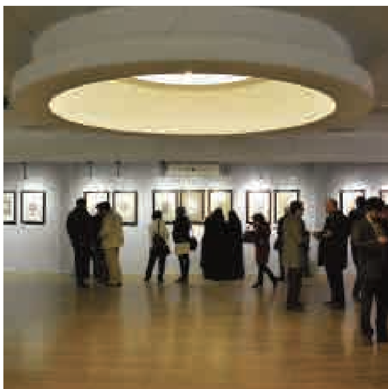
داوری و نمایشگاه آثار پنجمین دوسالانه تذهیب‌های قرآنی