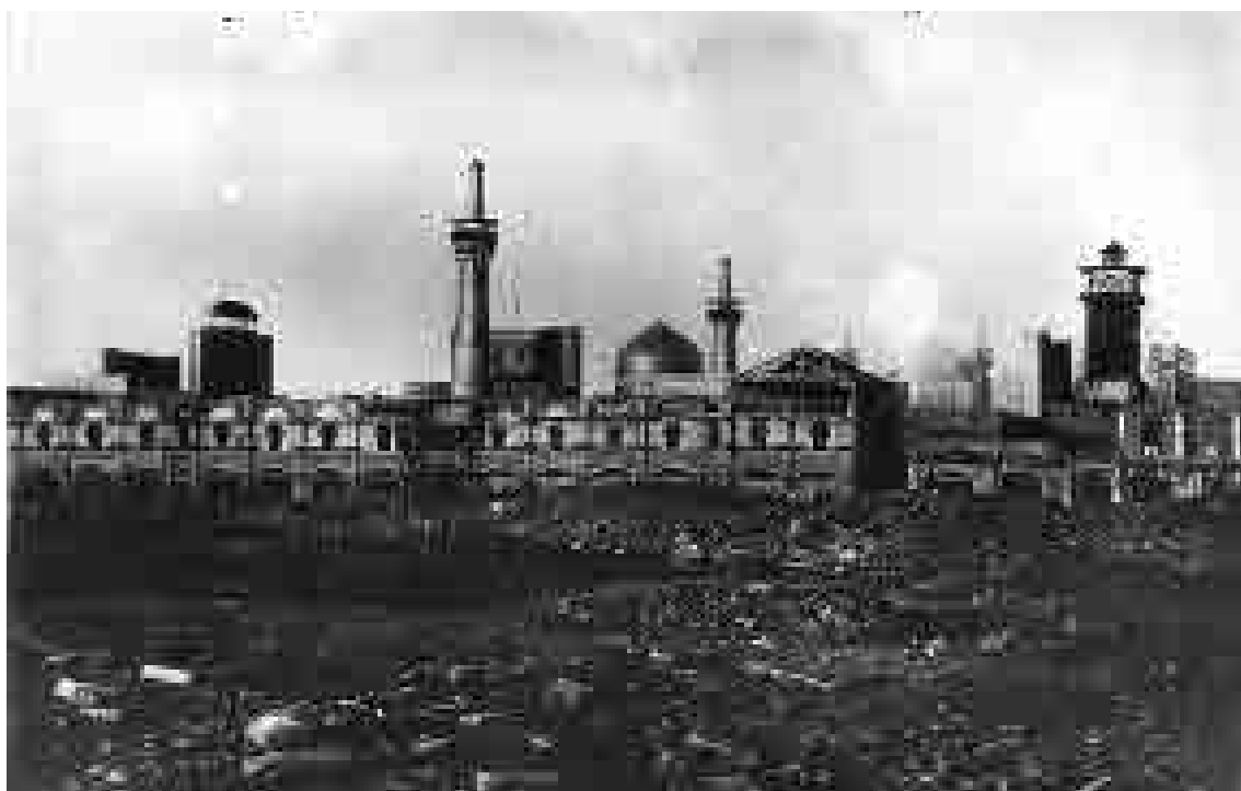
فضای پیرامون حرم امام رضا (ع) قبل از احداث خیابان فلکه در اوایل دوره پهلوی اول؛ عکاس: نامشخص