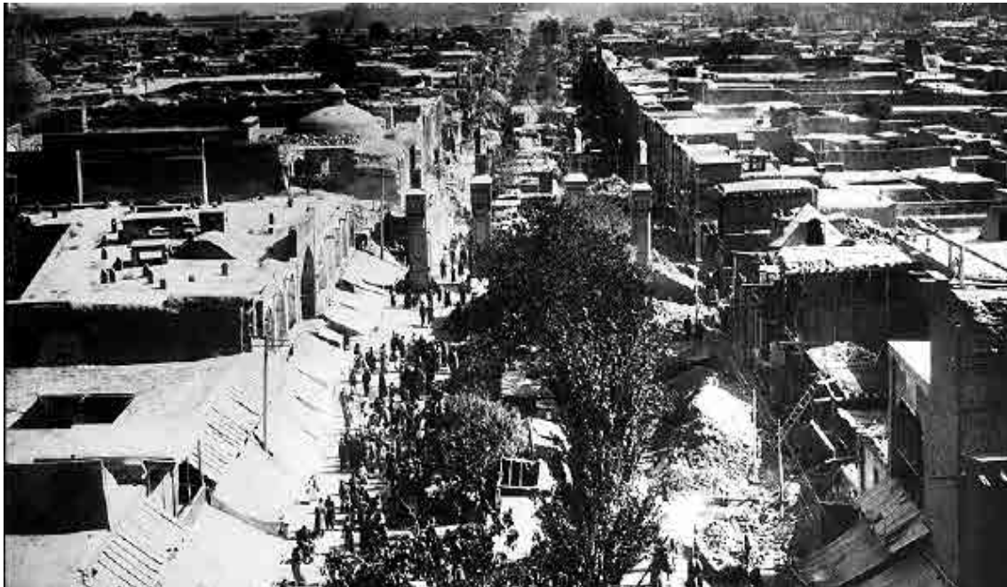
نمای قدیم پایین‌خیابان شهر مشهد در اوایل دوره پهلوی اول؛ عکاس: نامشخص؛ تاریخ: نامشخص