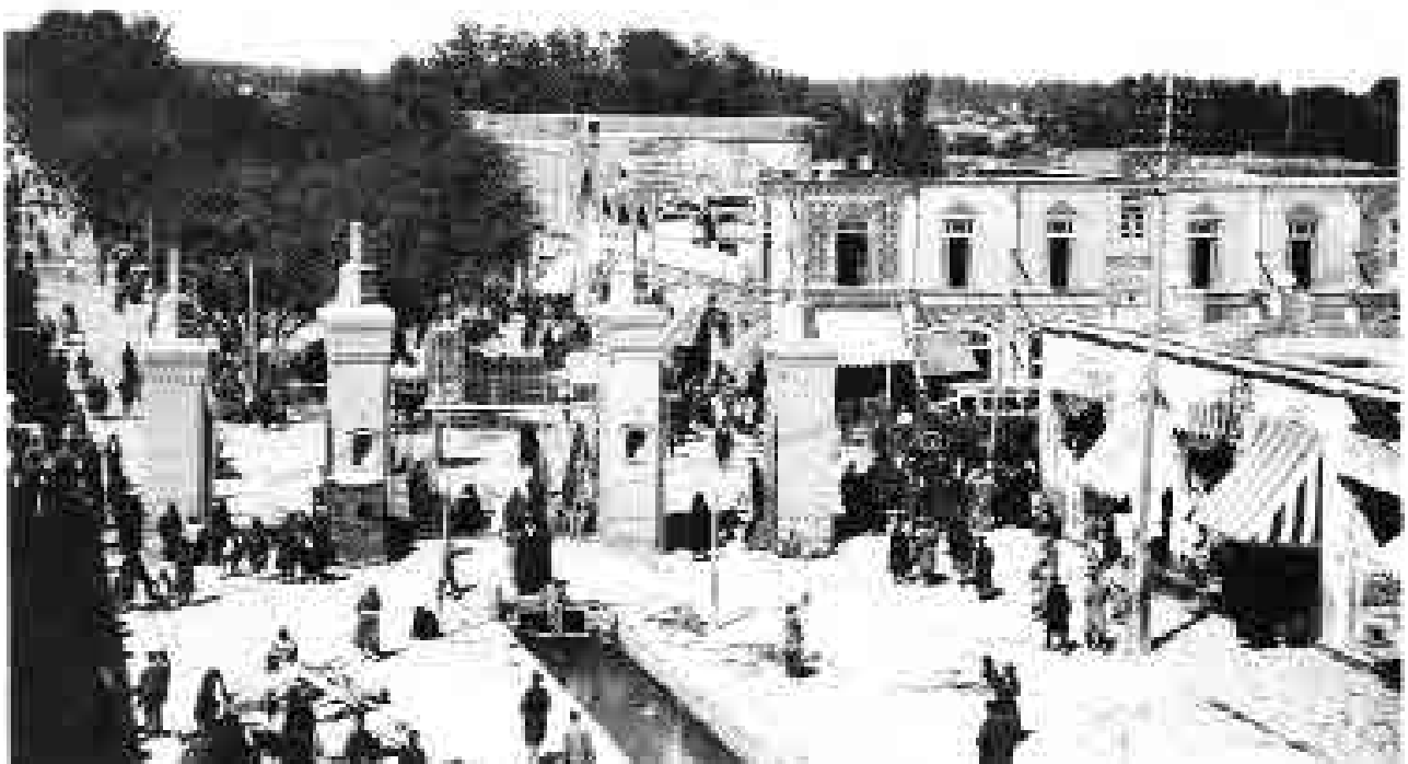
نمایی از بست بالا، اوایل پهلوی اول