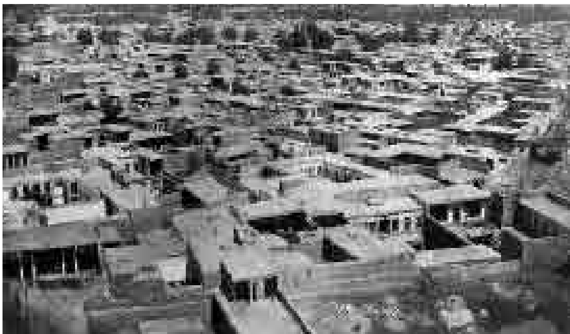
نمایی از منازل مسکونی و بافت قدیم اطراف حرم امام رضا(ع) در اواخر دوره قاجار؛ عکاس: منوچهرخان عکاس‌باشی؛ تاریخ عکس: ۱۳۰۰ق/۱۲۶۲ش