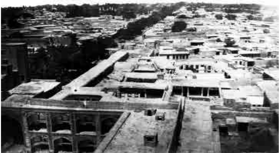
نمایی از بافت قدیم بالاخیابان شهر مشهد در دوره قاجار؛ عکاس: منوچهرخان عکاس‌باشی؛ تاریخ عکس: ۱۳۰۰ ق/۱۲۶۲ ش

در کتاب فرهنگ جغرافیای ایران که به‌صورت محرمانه و به تعداد محدود توسط ارتش انگلیس مستقر در هند در سال ۱۹۱۰ چاپ شده، شهر مشهد به شرح ذیل توصیف شده است: شهر مشهد به‌طور متوسط حدود یک و یک‌دوم مایل طول و یک مایل عرض (۱/۶ و ۲/۴ کیلومتر) دارد و با یک باروی گلی نامنظم با محیط تقریبی ۶ مایل (۹/۶۵ کیلومتر) محصور شده است (خادمیان، ۱۳۸۰: ۹۴۷). از این زمان به بعد، بنا به فضای سیاسی و مذهبی حاکم بر ایران، مختصات جغرافیایی شهر مشهد همواره در حال تغییر و تحول بوده است و در حال حاضر طول و عرض جغرافیایی فعلی شهر مشهد به‌هیچ‌وجه قابل‌مقایسه با دوره قاجار، دوره پهلوی و حتی اوایل دوره انقلاب اسلامی نیست، به‌طوری‌که به جرئت می‌توان گفت در حال حاضر برخلاف شهرهای دیگر ایران هیچ اثری از بافت قدیم شهر مشهد نمی‌توان پیدا کرد. اینک تنها سند گویای بافت قدیم اطراف حرم امام‌رضا(ع)، نقاشی‌ها و عکس‌های برجای‌مانده از هنرمندان و عکاسان مختلف در تاریخ دوپست سال اخیر است.