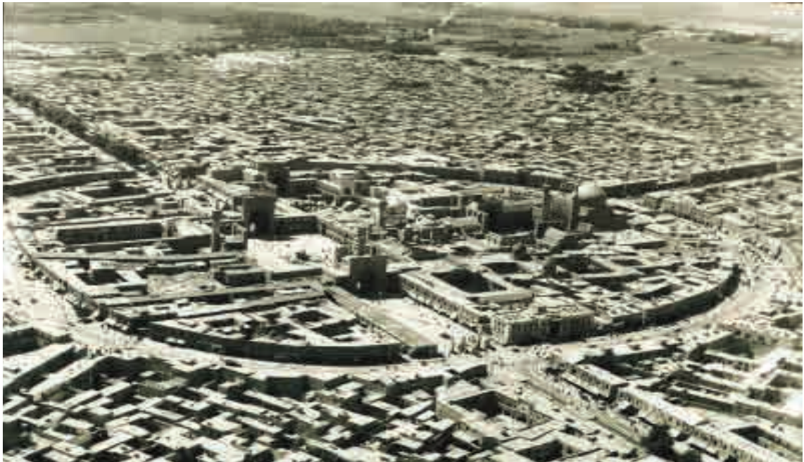
عکس هوایی از حرم امام رضا (ع) و فلکة قدیم حضرت معروف به فلکة شمالی و جنوبی (خیابان فلکه)