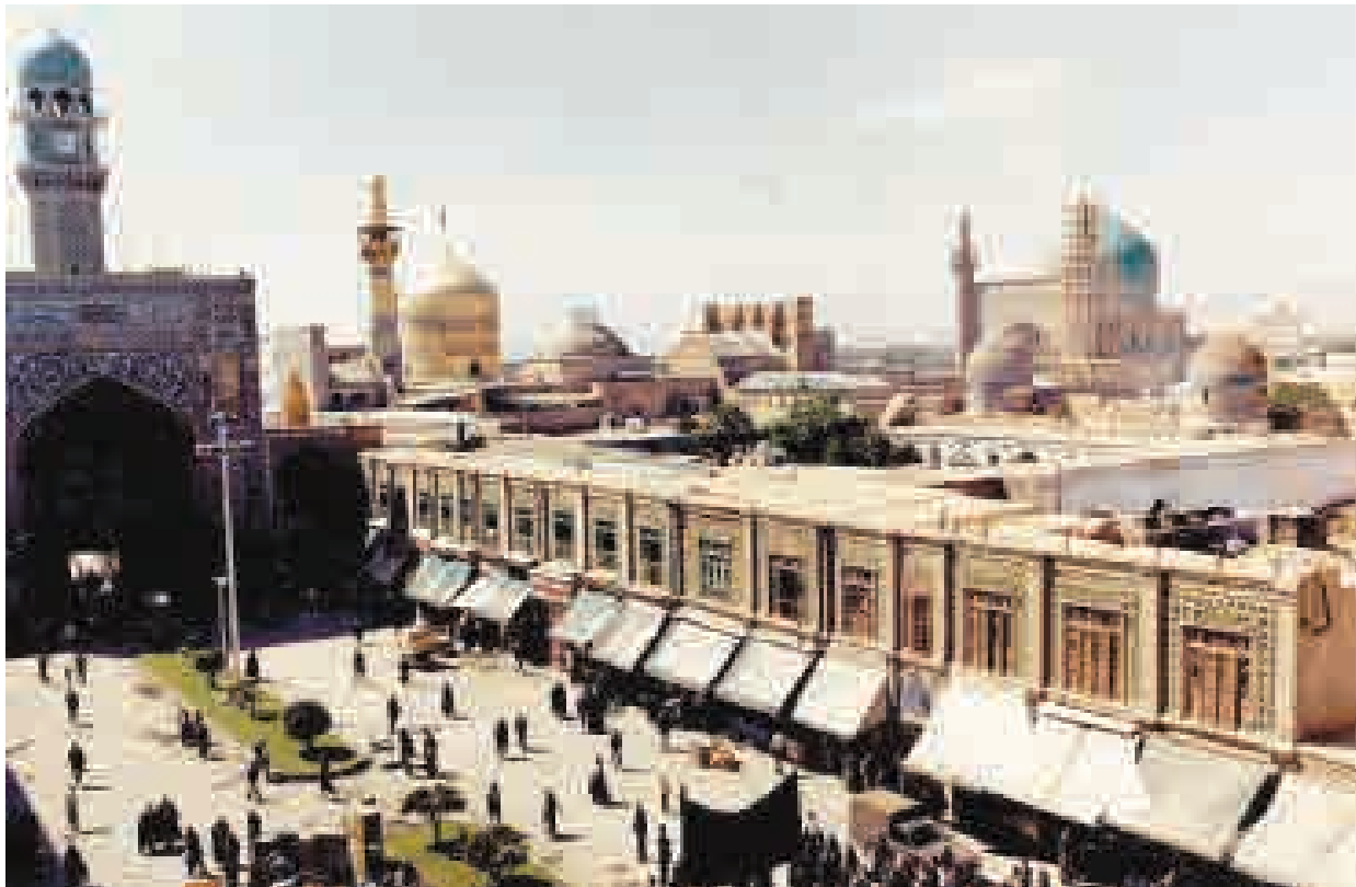
نمای فضای داخلی بست بالاخیابان در اواخر دوره پهلوی دوم؛ عکاس: علی اصغر ناصری مهر؛ تاریخ عکس: ۱۳۵۵ ش