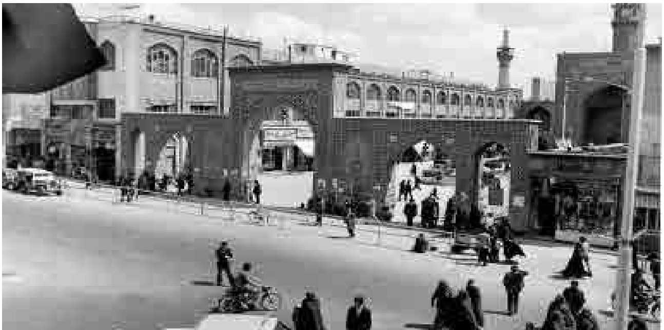
نمای سردر ورودی بست بالاخیابان و خیابان فلکه در اواخر دوره پهلوی دوم؛ عکاس: علی اصغر نصری مهر؛ تاریخ عکس: ۱۳۵۵ ش