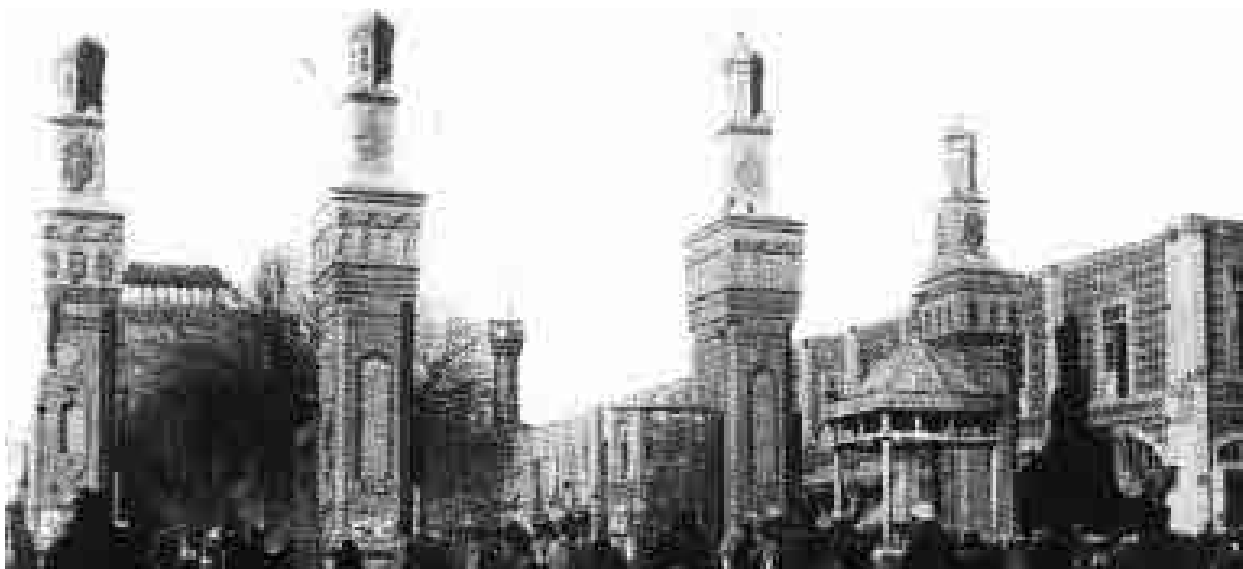
نمای ورودی بست پایین خیابان حرم امام رضا (ع) در اوایل دوره پهلوی که بعدها تخریب شد؛ عکاس: نامشخص؛ تاریخ عکس: نامشخص