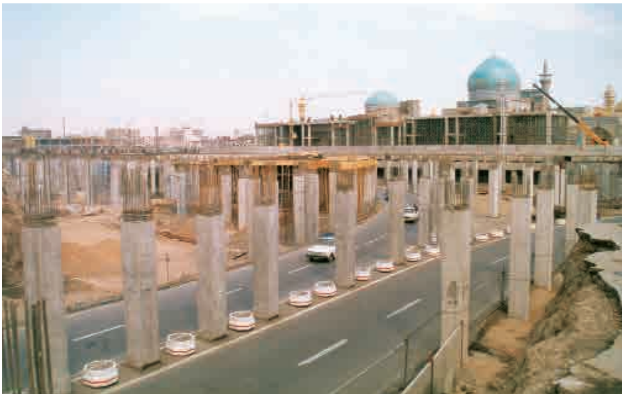
نمایی از ساخت و ساز زیر گذر حرم امام رضا(ع) در سال ۱۳۷۸؛ عکاس: نامشخص