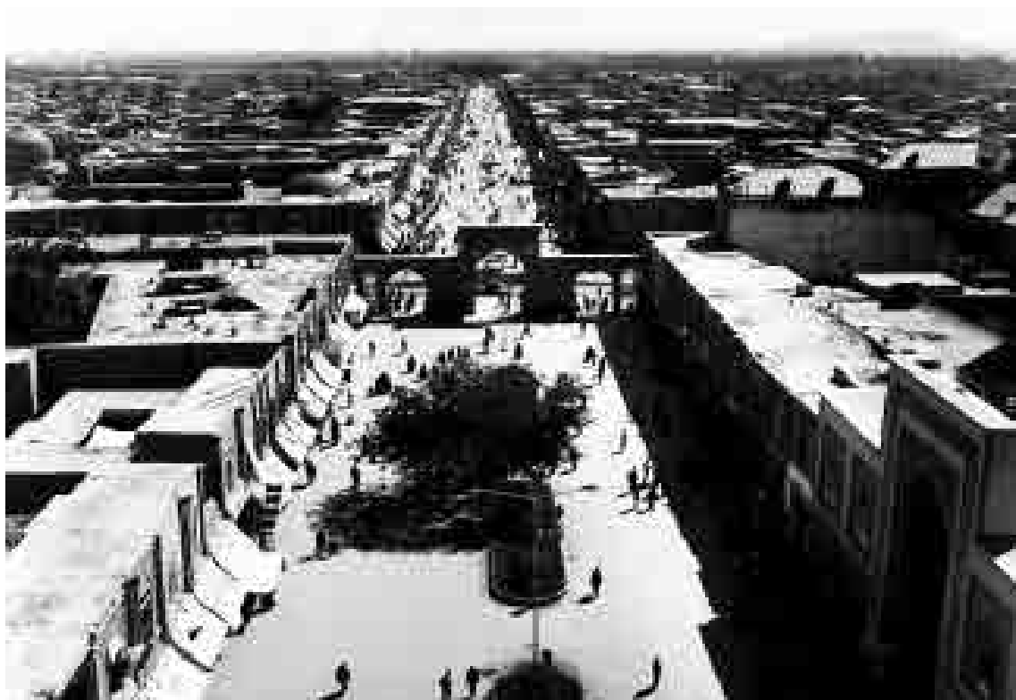
نمایی از زیست پایین حرم امام رضا (ع) در دوره پهلوی دوم؛ عکاس: محمد صانع؛ تاریخ عکس: ۱۳۵۱ ش