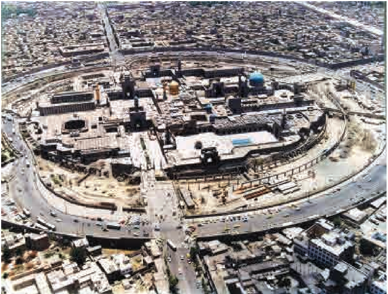
فضای پیرامون حرم امام رضا(ع) در اوایل دهه ۷۰ شمسی؛ عکاس: نامشخص