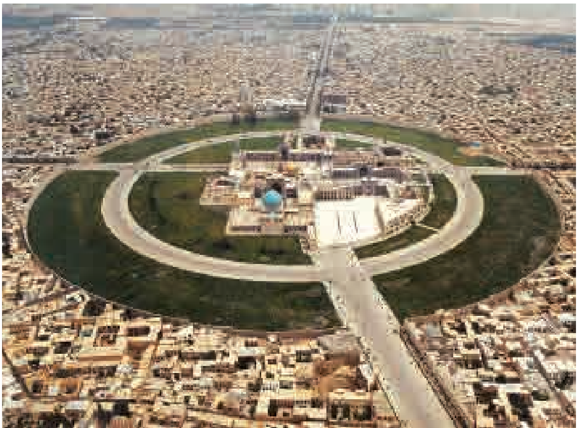
عکس هوایی از حرم امام رضا (ع) و فلکة حضرت؛ عکاس: علی اصغر ناصری مهر؛ تاریخ عکس: ۱۳۵۶ ش